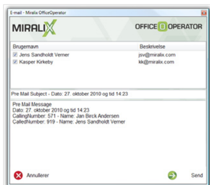
Afløber en telefonbesked pr. e-mail eller SMS.

Der oprettes som standard en kø for omstillingsbordet, men som tilvalg kan der også laves overblik over status på andre køer, hvor det er muligt at få vist kø længden for en ACD-gruppe.