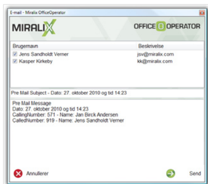
Afløber en telefonbesked pr. e-mail eller SMS.

Der oprettes som standard en kø for omstillingsbordet, men som tilvalg kan der også laves overblik over status på andre køer, hvor det er muligt at få vist kø længden for en ACD-gruppe.